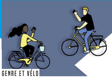
GENRE ET VÉLO