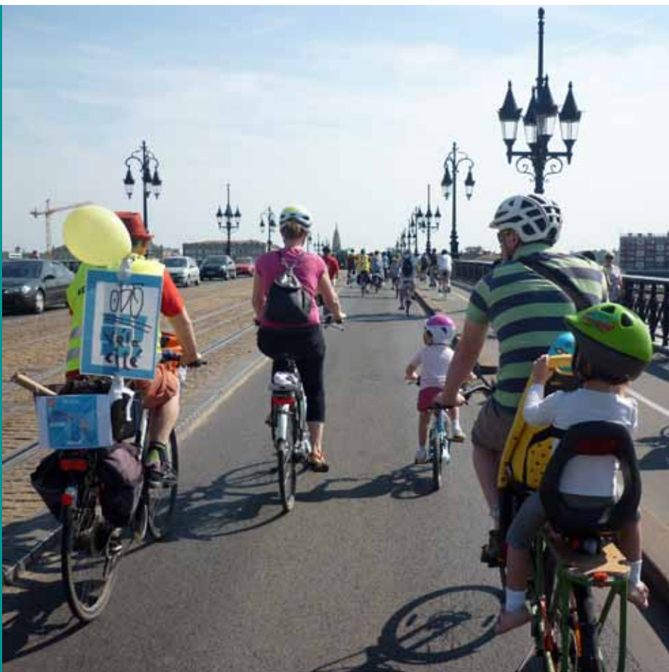
Fête du vélo - 7 juin

Pour revenir à nos questions, il serait temps que les collectivités prennent des mesures vraiment incitatives