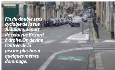
Fin du double sens cyclable de la rue Judaique, départ de celui rue Brizard à droite. On devine l'entrée de la piscine plus bas à quelques mètres, dommage.