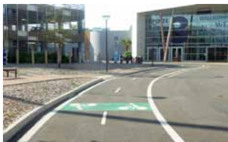
Le long de l'extension de Mérignac Soleil

Du côté de l'espoir, nous notons de plus en plus d'aménagements cyclables à l'intérieur des centres commerciaux, comme celui photographié ci-dessous, qui est venu ceindre l'extension de Mérignac Soleil et relier deux quartiers qu'un kilomètre séparerait sinon : la rue du Pradas derrière le centre et les nouveaux aménagements réalisés par Bordeaux Métropole et Mérignac de l'autre côté.