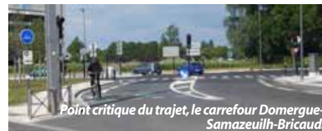
Point critique du trajet, le carrefour Domergue-Samazeuilh-Bricaud. L'aménagement est réussi et le cycliste qu'on voit sur la photo et qui l'utilise chaque jour m'en a dit du bien

(*) ààààà deux-roues, grognonne la rédac', sauf si on voyage dans le réservoir d'essence.