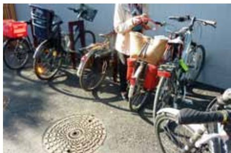
Parking très encombré, proche d'une entrée

Plutôt du côté de l'espoir, avec un effort à poursuivre, des stationnements assez nombreux mais peu visibles, comme le démontre notre reportage-photo et les entretiens avec les cyclistes plutôt nombreux en ce mercredi matin.