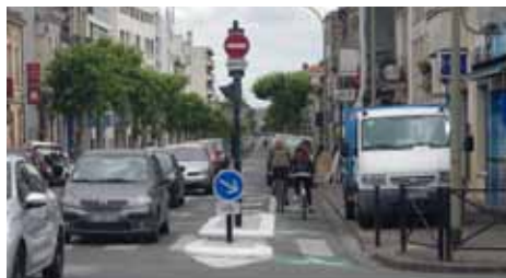
Le départ du double sens cyclable rue Judaique au niveau des boulevards

Et pour ne rien vous cacher on avait demandé plus : de mettre aussi en double sens les 140 mètres de la rue Judaique qui vont de la rue Brizard vers la place Tartas et le carrefour avec les rues Chauffour et Lachassaigne. En effet, ça permettait de boucler l'aménagement prévu avec la rue Sullivan et de ne pas stopper le double sens 80 mètres avant la piscine Judaique (rageant tout de même). 140 mètres pas faciles et coûteux à retravailler, on l'avoue : il aurait fallu supprimer 7 places de stationnement auto sur la chaussée (7 places, oui, vous avez bien lu, quelle horreur !), décaler une place de manutention, déplacer la station VCub sur la place Tartas et retravailler une partie de la place Tartas... C'était trop rêver. Mais ne boudons pas notre plaisir, et savourons ce qui a été fait.