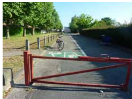
Mérignac Soleil de nouveau, accès vers la rue du Pradas

Que coûterait de modifier un peu ces portails pour permettre aux cyclistes de passer, tout en maintenant leur fonction anti-autos ? Probablement pas même un millième du prochain silo à autos ! Allez, encore un effort, tout le monde y gagnera, notre niveau en steeple chase dût-il baisser !