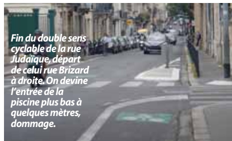
Fin du double sens cyclable de la rue Judaique, départ de celui rue Brizard à droite. On devine l'entrée de la piscine plus bas à quelques mètres, dommage.