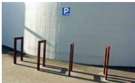
Celui-là, à peine plus loin de l'entrée, est vide.

Les deux cyclistes interrogés ont déclaré n'avoir vu que celui-ci (vu le stock de chariots amassés devant, ils doivent avoir le goût du défi). L'un d'eux a regretté qu'il n'y ait plus de parking abrité, le vieux parking à vélo ayant été détruit pour la construction du deuxième parking à silo.