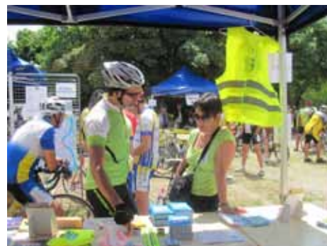
Toujours de bons conseils au stand Vélo-Cité...