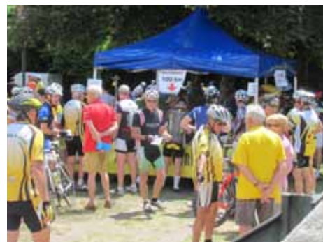
Attention départ rando pro !