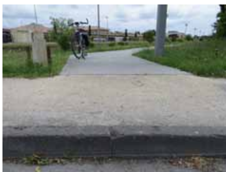
Mais un bien vilain trottoir à l'autre bout !

Bon, une nouvelle piste, ça n'a rien d'exceptionnel. Alors pourquoi en parler ? Eh bien pour deux raisons. La première c'est sa situation intéressante puisqu'elle relie l'avenue de Magudas à l'avenue de Saint-Médard (et réciproquement !). Elle longe la