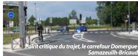
Point critique du trajet, le carrefour Domergue-Samazeuilh-Bricaud. L'aménagement est réussi et le cycliste qu'on voit sur la photo et qui l'utilise chaque jour m'en a dit du bien

(*) ààààà deux-roues, grognonne la rédac', sauf si on voyage dans le réservoir d'essence.