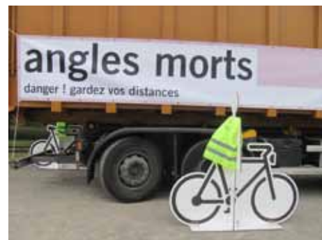
Le stand le plus impressionnant de la fête qu'il ne fallait pas manquer !