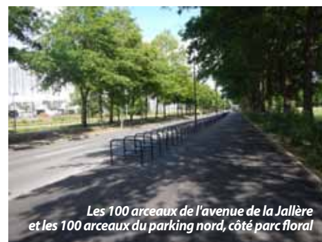
Les 100 arceaux de l'avenue de la Jallère et les 100 arceaux du parking nord, côté parc floral