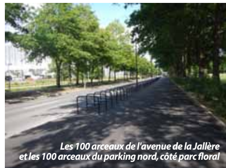
Les 100 arceaux de l'avenue de la Jallère et les 100 arceaux du parking nord, côté parc floral