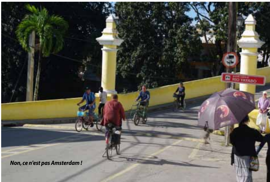
Non, ce n'est pas Amsterdam !