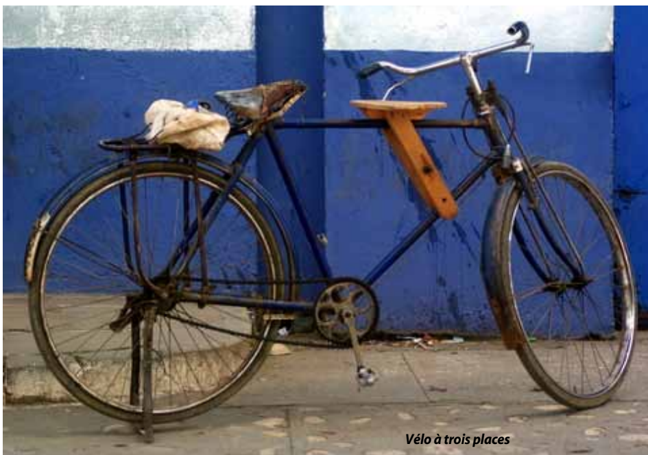
Vélo à trois places