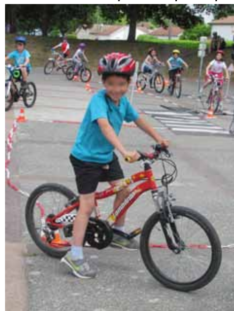
Initiation au code de la route, appréciée des enfants