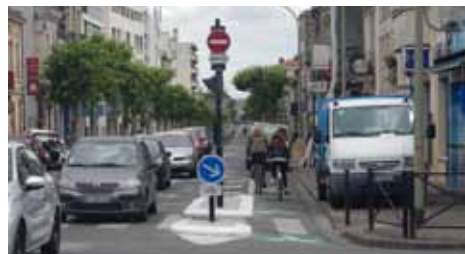
Le départ du double sens cyclable rue Judaique au niveau des boulevards

Et pour ne rien vous cacher on avait demandé plus : de mettre aussi en double sens les 140 mètres de la rue Judaique qui vont de la rue Brizard vers la place Tartas et le carrefour avec les rues Chauffour et Lachassaigne. En effet, ça permettait de boucler l'aménagement prévu avec la rue Sullivan et de ne pas stopper le double sens 80 mètres avant la piscine Judaique (rageant tout de même). 140 mètres pas faciles et coûteux à retravailler, on l'avoue : il aurait fallu supprimer 7 places de stationnement auto sur la chaussée (7 places, oui, vous avez bien lu, quelle horreur !), décaler une place de manutention, déplacer la station VCub sur la place Tartas et retravailler une partie de la place Tartas... C'était trop rêver. Mais ne boudons pas notre plaisir, et savourons ce qui a été fait.