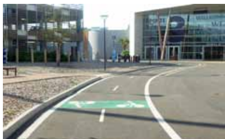
Le long de l'extension de Mérignac Soleil

Du côté de l'espoir, nous notons de plus en plus d'aménagements cyclables à l'intérieur des centres commerciaux, comme celui photographié ci-dessous, qui est venu ceindre l'extension de Mérignac Soleil et relier deux quartiers qu'un kilomètre séparerait sinon : la rue du Pradas derrière le centre et les nouveaux aménagements réalisés par Bordeaux Métropole et Mérignac de l'autre côté.