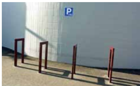
Celui-là, à peine plus loin de l'entrée, est vide.

Les deux cyclistes interrogés ont déclaré n'avoir vu que celui-ci (vu le stock de chariots amassés devant, ils doivent avoir le goût du défi). L'un d'eux a regretté qu'il n'y ait plus de parking abrité, le vieux parking à vélo ayant été détruit pour la construction du deuxième parking à silo.