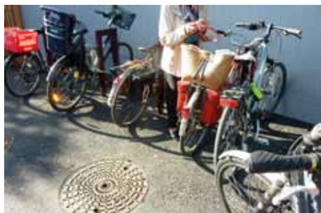
Parking très encombré, proche d'une entrée

Plutôt du côté de l'espoir, avec un effort à poursuivre, des stationnements assez nombreux mais peu visibles, comme le démontre notre reportage-photo et les entretiens avec les cyclistes plutôt nombreux en ce mercredi matin.