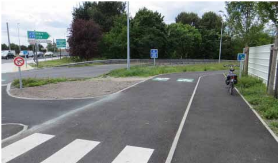
Un beau début de piste (en fait une voie verte) près de la sortie 9 de la rocade...