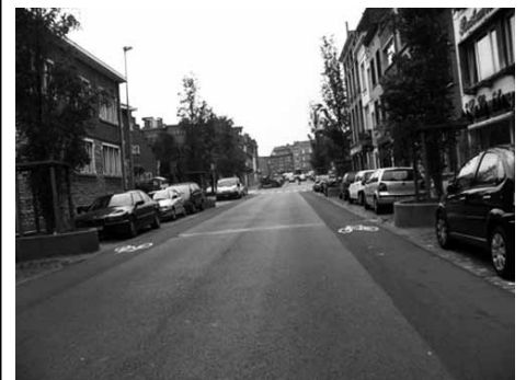
Chaucidou à Anderlecht. D'après http://www.provelo.org , licence Creative Commons.

Le mercredi 6 octobre, Muriel Sola était présente à la plaine des sports des Écus, au village « Sécurité routière » organisé par le bureau Information jeunesse, afin d'informer petits et grands sur la pratique du vélo, le code de la route, et de discuter du plan cyclable de la ville. Le stand n'a pas désempé, l'intérêt pour le vélo se confirme à chacune de nos participations.