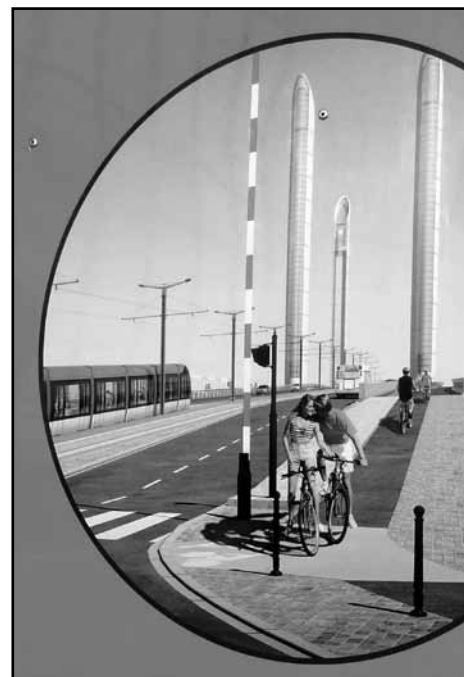
Sur le pont Bacalan Bastide en construction, les vélos rouleront sur des passerelles séparées et protégées des voies de circulation des voitures et transports en commun.

Il faudra permettre aux cyclistes le trajet du pont Mitterrand au pont d'Aquitaine par un réseau cyclable continu et sûr.