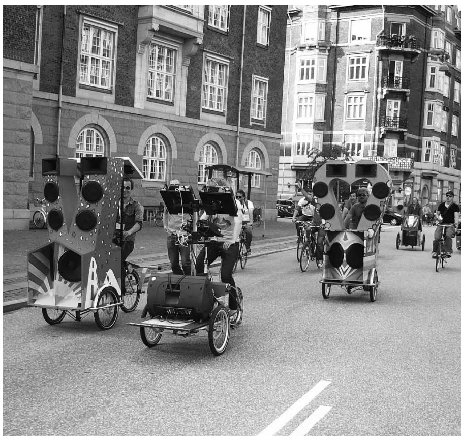
Bike parade dans Copenhague

Ainsi, Vélo-Cité reste une structure militante indispensable. Il nous faut même augmenter encore notre nombre d'adhérents pour accroître notre influence. Vélo-Cité repose sur vous et a besoin qu'un flux régulier d'adhérents s'investissent – pour ce qu'ils souhaitent et pour ce qu'ils peuvent – au conseil d'administration, à la commission technique ou dans nos actions d'animation. L'action militante associative est enrichissante, engagez-vous ! Chaque assemblée générale – la prochaine se tient le 27 janvier – est un moment démocratique fondamental