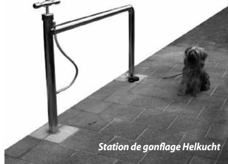
Station de gonflage Helkucht