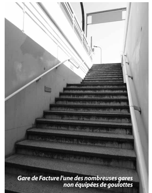
Gare de Facture l'une des nombreuses gares non équipées de goulottes