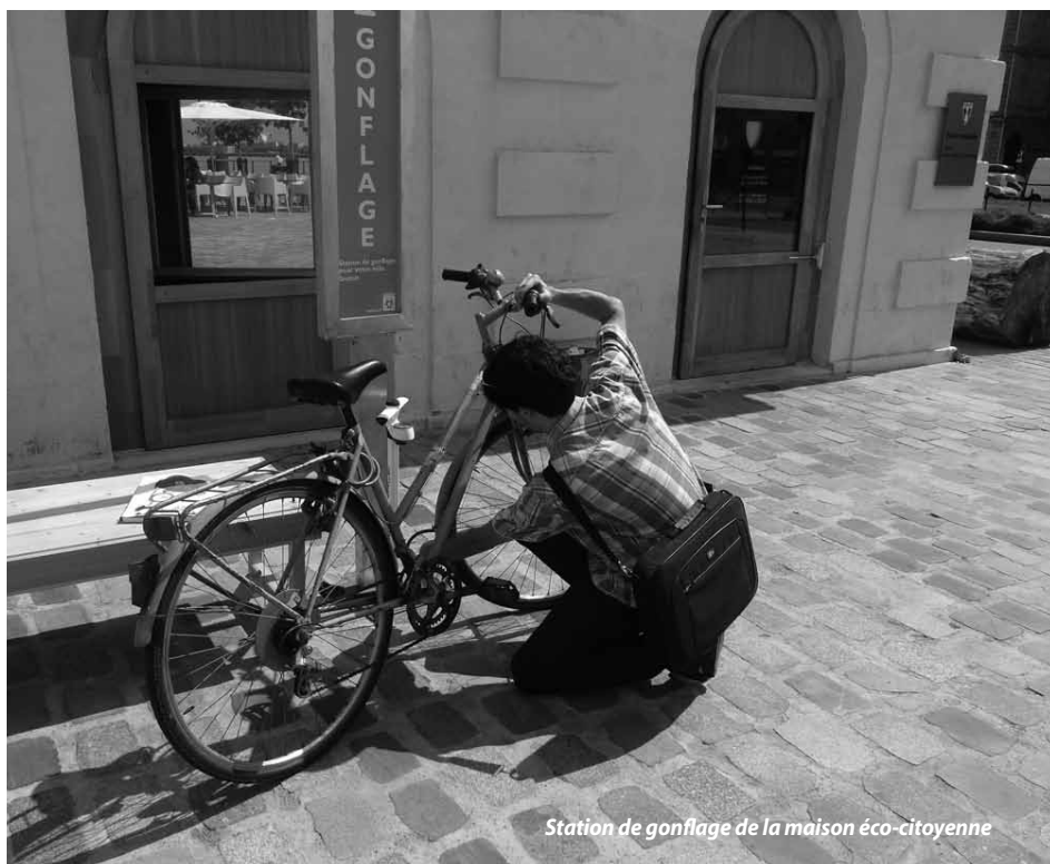
Station de gonflage de la maison éco-citoyenne