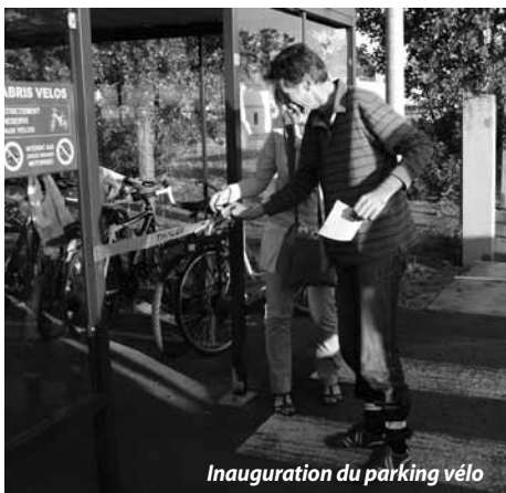
Inauguration du parking vélo

Enfin, le domaine de Fantaisie près des Eyquems nous a contactés pour élaborer des itinéraires vélos autour du collège ; nous serons bien sûr à leurs côtés.