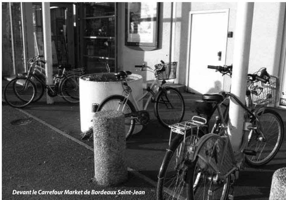
Devant le Carrefour Market de Bordeaux Saint-Jean

Un de nos objectifs en matière de stationnement vélo est l'équipement des supermarchés. Beaucoup rechignent en effet à investir dans des parkings à vélos de qualité. Bien souvent, nous devons nous contenter de pince-roues situés loin des entrées du magasin.