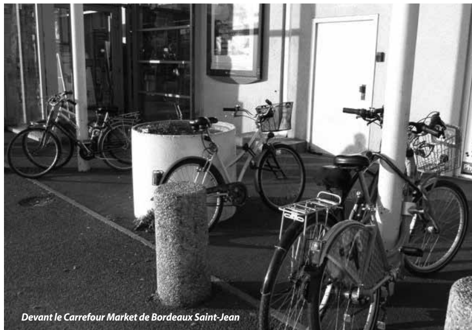
Devant le Carrefour Market de Bordeaux Saint-Jean

Un de nos objectifs en matière de stationnement vélo est l'équipement des supermarchés. Beaucoup rechignent en effet à investir dans des parkings à vélos de qualité. Bien souvent, nous devons nous contenter de pince-roues situés loin des entrées du magasin.