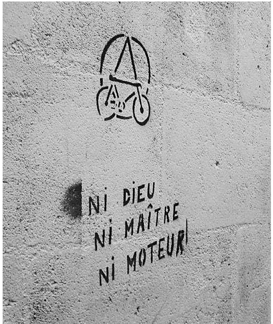
Vu rue Sainte-Philomène à Bordeaux

Notre journal paraît cinq fois par an et le premier bulletin de chaque année n'est publié qu'en février. C'est donc un peu tard pour les traditionnels vœux de bonne année et de bonne santé. Mais cette circonstance me fournit au moins l'occasion de rebondir sur le thème de la santé. Quand on développe les arguments en faveur de l'usage urbain de la bicyclette (efficace, pas de pollution, pas de bruit, économique...), un argument provoque souvent un sourire condescendant : la santé. Bien souvent, votre interlocuteur vous reprend sur le thème de l'insécurité à vélo. Pourtant, la santé est un argument fondamental en faveur de la bicyclette. Les centaines d'études scientifiques sur ce thème convergent toutes et permettent même de chiffrer le rapport santé/insécurité. Le chiffre retenu et reconnu officiellement pour la France en 2008 (par exemple par la direction générale de la compétitivité, de l'industrie et des services du ministère de l'économie) est de 5,6 milliards d'euros. Ce chiffre colossal correspond à l'économie annuelle globale liée aux moindres dépenses de santé des cyclistes. Par extrapolation, une part modale de 15 % en 2020 triplerait les impacts sur la santé et engendrerait une économie de dépenses de 15 milliards d'euros, on n'en demande pas tant ! Ces chiffres ne sont pas faciles à expliquer car ils correspondent à un bilan collectif et évidemment pas à une protection individuelle, mais ils doivent être entendus et retenus.