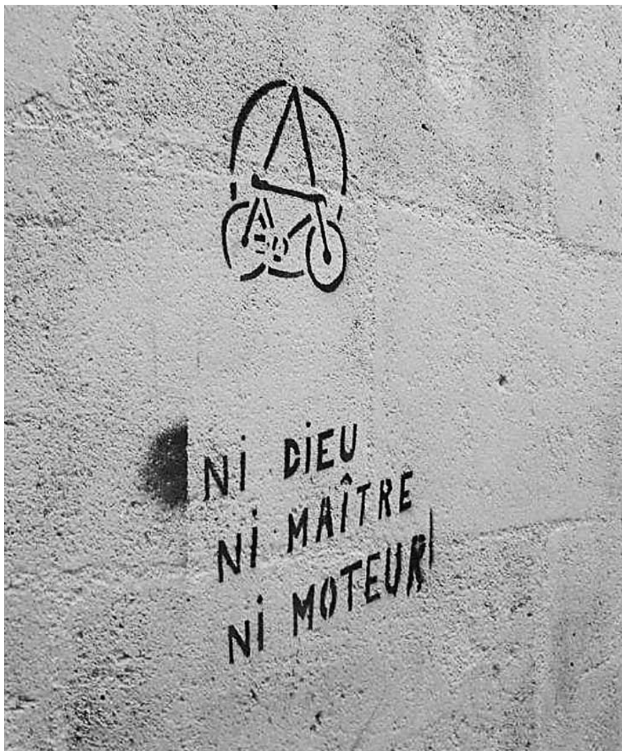
Vu rue Sainte-Philomène à Bordeaux

Notre journal paraît cinq fois par an et le premier bulletin de chaque année n'est publié qu'en février. C'est donc un peu tard pour les traditionnels vœux de bonne année et de bonne santé. Mais cette circonstance me fournit au moins l'occasion de rebondir sur le thème de la santé. Quand on développe les arguments en faveur de l'usage urbain de la bicyclette (efficace, pas de pollution, pas de bruit, économique...), un argument provoque souvent un sourire condescendant : la santé. Bien souvent, votre interlocuteur vous reprend sur le thème de l'insécurité à vélo. Pourtant, la santé est un argument fondamental en faveur de la bicyclette. Les centaines d'études scientifiques sur ce thème convergent toutes et permettent même de chiffrer le rapport santé/insécurité. Le chiffre retenu et reconnu officiellement pour la France en 2008 (par exemple par la direction générale de la compétitivité, de l'industrie et des services du ministère de l'économie) est de 5,6 milliards d'euros. Ce chiffre colossal correspond à l'économie annuelle globale liée aux moindres dépenses de santé des cyclistes. Par extrapolation, une part modale de 15 % en 2020 triplerait les impacts sur la santé et engendrerait une économie de dépenses de 15 milliards d'euros, on n'en demande pas tant ! Ces chiffres ne sont pas faciles à expliquer car ils correspondent à un bilan collectif et évidemment pas à une protection individuelle, mais ils doivent être entendus et retenus.