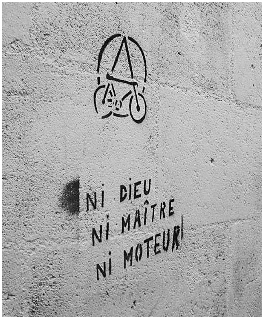
Vu rue Sainte-Philomène à Bordeaux

Notre journal paraît cinq fois par an et le premier bulletin de chaque année n'est publié qu'en février. C'est donc un peu tard pour les traditionnels vœux de bonne année et de bonne santé. Mais cette circonstance me fournit au moins l'occasion de rebondir sur le thème de la santé. Quand on développe les arguments en faveur de l'usage urbain de la bicyclette (efficace, pas de pollution, pas de bruit, économique...), un argument provoque souvent un sourire condescendant : la santé. Bien souvent, votre interlocuteur vous reprend sur le thème de l'insécurité à vélo. Pourtant, la santé est un argument fondamental en faveur de la bicyclette. Les centaines d'études scientifiques sur ce thème convergent toutes et permettent même de chiffrer le rapport santé/insécurité. Le chiffre retenu et reconnu officiellement pour la France en 2008 (par exemple par la direction générale de la compétitivité, de l'industrie et des services du ministère de l'économie) est de 5,6 milliards d'euros. Ce chiffre colossal correspond à l'économie annuelle globale liée aux moindres dépenses de santé des cyclistes. Par extrapolation, une part modale de 15 % en 2020 triplerait les impacts sur la santé et engendrerait une économie de dépenses de 15 milliards d'euros, on n'en demande pas tant ! Ces chiffres ne sont pas faciles à expliquer car ils correspondent à un bilan collectif et évidemment pas à une protection individuelle, mais ils doivent être entendus et retenus.