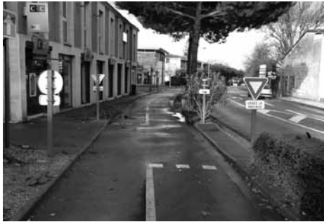
■ Georges Chounet

arceaux à vélos ont été placés sous des barres en alu qui ornent la façade du bâtiment et dont les bords vifs arrivent juste à hauteur du crâne d'un cycliste de taille moyenne !