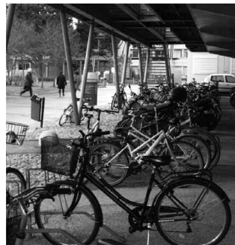
Stationnement des vélos sur le site de Carreire. Des accroche-roue évidemment. Les cyclistes cherchent tant bien que mal à y attacher leur cadre ou vont ailleurs à la recherche de barrières accueillantes.