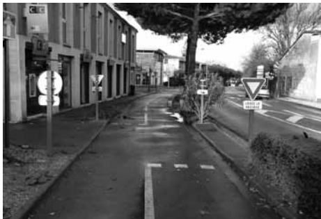
■ Georges Chounet

arceaux à vélos ont été placés sous des barres en alu qui ornent la façade du bâtiment et dont les bords vifs arrivent juste à hauteur du crâne d'un cycliste de taille moyenne !