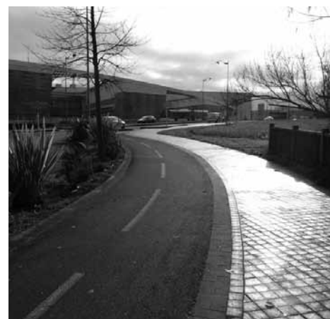
La piste qui conduit au campus TPG depuis la Béchade, Tauzin et les vignes. Une très belle réalisation qui ne doit pas masquer la très mauvaise cyclabilité vers TPG.