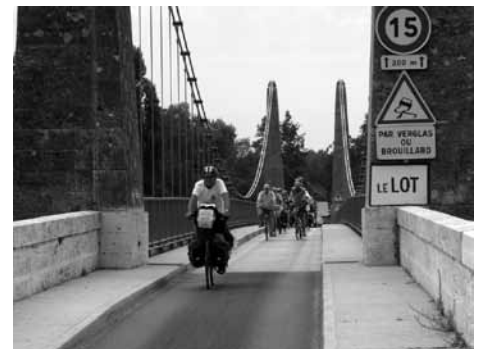
La randonnée 2011