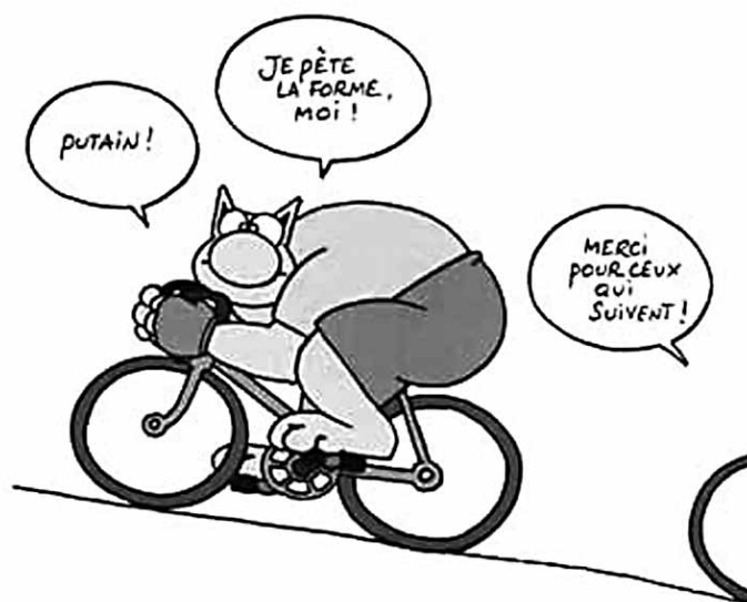
Philippe Geluck - Le chat

(Toute reproduction, même partielle, interdite sur la toile. Hors la toile, contacter l'auteur, por favor)