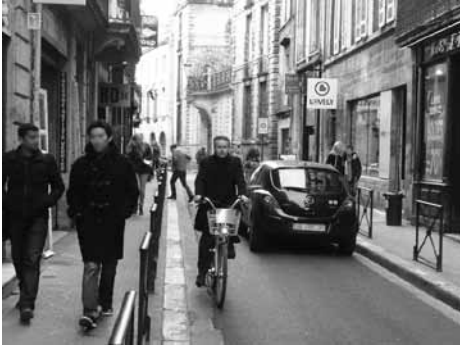
DSC rue du Loup, 3 m de largeur de chaussée. Même en présence d'une camionnette et d'un piéton sur la chaussée, tout va bien se passer

C'est une visite de terrain à la Bastide qui est à l'origine de cet article. La rue Nuyens, qui longe un groupe scolaire, est en sens unique. Les services techniques de la CUB ne sont pas favorables à sa mise à 30 km/h et à double-sens cyclable (DSC), compte-tenu de son trafic relativement élevé et de sa faible largeur (3 m 20). Ces arguments m'ont donné à cogiter. À Vélo-Cité, nous militons pour la « ville à 30 », une ville où toutes les chaussées ont vocation à être en double-sens cyclable. Et nous le voulons pour demain, donc, pour la rue Nuyens et les nombreuses rues qui lui ressemblent, dans les conditions actuelles de trafic.