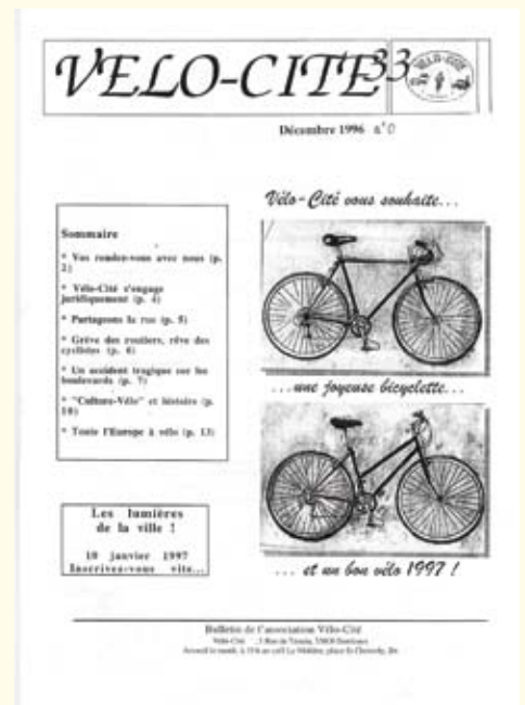
Bulletin de décembre 1996