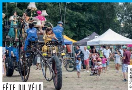
FÊTE DU VÉLO