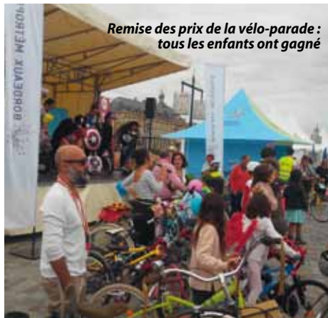
Remise des prix de la vélo-parade : tous les enfants ont gagné