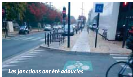
Les jonctions ont été adoucies

En allant photographier ces reprises des jonctions, je suis passé devant la clinique Bel-Air. Longeant l'entrée du parking souterrain autos, on trouve des places de stationnement vélos. Mais consternation, il s'agit de méchants accroche-roues. C'est dingue comme ce mauvais système à la vie dure. À quelques mètres de là, Bordeaux Métropole donne l'exemple avec des arceaux classiques et pratiques. À Bel-Air en revanche, on sait faire une entrée de parking auto mais on ne connaît rien au stationnement des vélos.