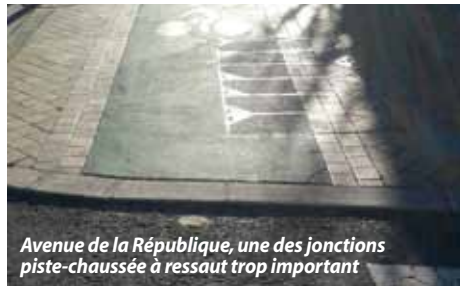
Avenue de la République, une des jonctions piste-chaussée à ressaut trop important

Par exemple, Vélo-Cité a transmis fin août à BM une cyclofiche au contenu suivant : « Bordeaux. De nombreuses bordures sur les pistes de l'avenue de la République ont un dénivelé très important. Les jonctions continues en asphalte sont plus confortables pour les cyclistes et permettent d'éviter les chocs, qui contribuent au voilage des roues. Ce problème est signalé régulièrement par les cyclistes et également par les personnes à mobilité réduite ». Ce texte était accompagné de trois photographies dont une est reproduite ci-dessous. Eh bien, depuis quelques semaines, les jonctions chaotiques ont été reprises. Conclusion, pensez cyclofiches ! Il suffit de nous adresser un mail avec une description précise, éventuellement une photo ou deux.