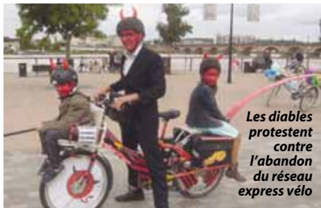
Les diables protestent contre l'abandon du réseau express vélo

À l'occasion de la semaine de la mobilité, Bordeaux Métropole avait installé un village vélo sur le parvis de la maison éco-citoyenne, en présence des acteurs associatifs et institutionnels du vélo, suivie d'une vélo-parade le dimanche 18 septembre. Vélo-Cité était de la partie avec Récup'R. Notre stand a reçu de nombreux visiteurs. Les discussions ont très majoritairement porté sur trois thèmes familiers : la sécurité, les discontinuités et le respect du code de la route.