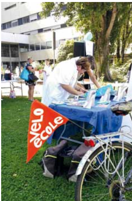
Au travail à vélo au CHU Pellegrin

la co-organisation d'une vélorution, le festival cyclo-ciné de la Maison du vélo et des mobilités à Bègles, et pour finir le « Parking day » associatif rue Ravez à Bordeaux.