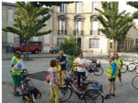
Encadrement de la balade à vélo des Participiales

En fait, notre semaine de la mobilité à nous commence souvent encore plus tôt, avec les forums des associations de la rentrée en septembre, où nous vantons sans faiblir les avantages du vélo. Nous étions ainsi cette année aux forums des associations de Talence, Mérignac, Gradignan, Floirac et Bordeaux, à la journée « Bougez autrement » organisée par la Conciergerie solidaire dans le quartier Ginko, aux journées « Allez au travail autrement » du CHU Pellegrin et Haut-Lévêque. Ensuite, nous avons participé à l'encadrement de la balade découverte de la ville de Bruges pour les nouveaux habitants, aux Participiales de Bordeaux, à la vélo-parade de Bordeaux Métropole. Et c'est pas tout ! Ajoutons à cela une remise en selle pour le personnel de la DREAL,