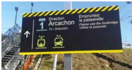
Pas de signalétique pour les cyclistes

ainsi que l'installation d'escaliers provisoires sont en cours de réalisation. Le passage d'un quai à l'autre ne peut se faire qu'en empruntant le pont