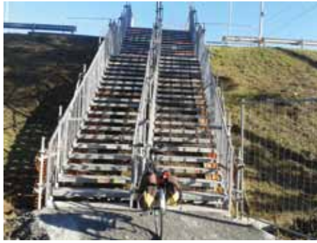
Une ascension bien dure pour les cyclistes !

Pendant la première phase du chantier, de janvier à juin, seront installés les nouveaux escaliers avec goulottes, et des ascenseurs assez larges pour les vélos. Le balisage et l'éclairage du cheminement