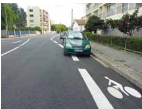
Hélas, le stationnement interdit perturbe la circulation des cyclistes