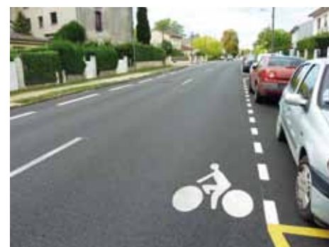
Une discontinuité regrettable