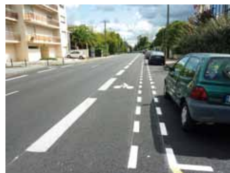
Une zone hachurée éloigne les cyclistes des véhicules en stationnement