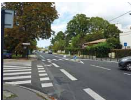
La suppression des tourne-à-gauche assure la continuité de la bande et un îlot pour la traversée des piétons